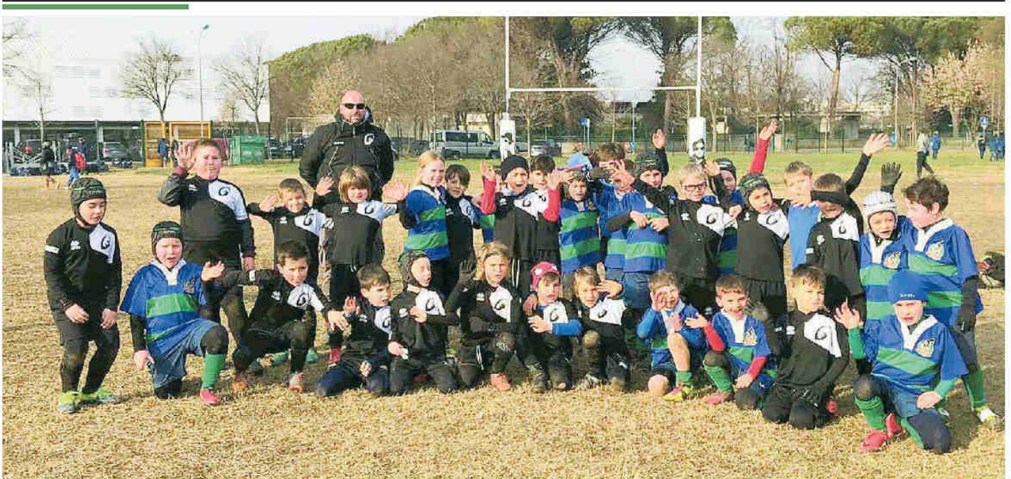
I baby rugbisti delle formazioni Under 8 di Mirano e Riviera posano per la foto di gruppo al Derby Day