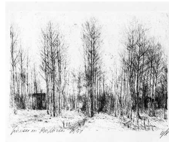
Giovanni Barbisan, I pioppi , 1951