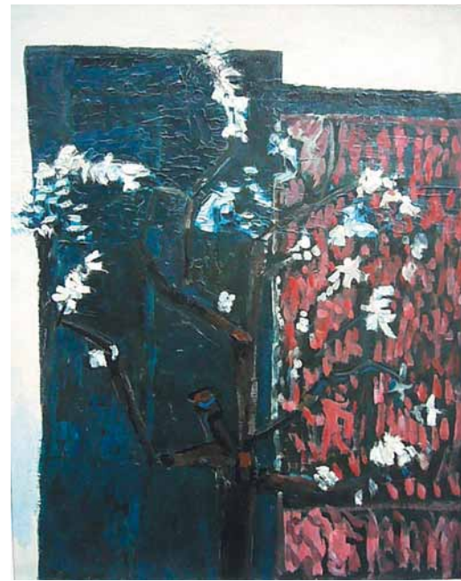
Alberto Gianquinto, Il melo , 1958

Del liceo partecipano alcuni studenti con un duplice intervento: un approfondimento relativo al versante matematico-botanico della teoria armonistica di Kayser, proposto al pubblico in una forma inedita; una performance in cui l'immedesimazione fisica nelle piante, evocate da alcuni testi poetici, accompagna la recitazione dei versi di questi testi secondo la tradizione del laboratorio teatrale del liceo. La scuola primaria di Ballò partecipa con l'esposizione, collocata all'esterno della Barchessa, dei teli su cui i bambini di classe prima hanno dipinto con le mani alberi esaminati attraverso osservazioni scientifiche acquisite con il gioco, mentre le classi prima, quarta e quinta eseguono danze ebraiche e celtiche attraverso le quali hanno sperimentato sul piano corporeo, a partire dal battito cardiaco e dal ritmo respiratorio, i rapporti armonici.