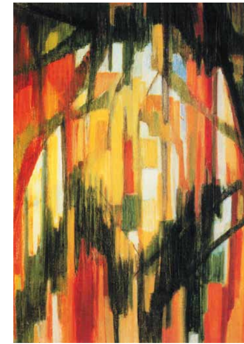
Sara Campesan, Alberi sul fiume , 1957