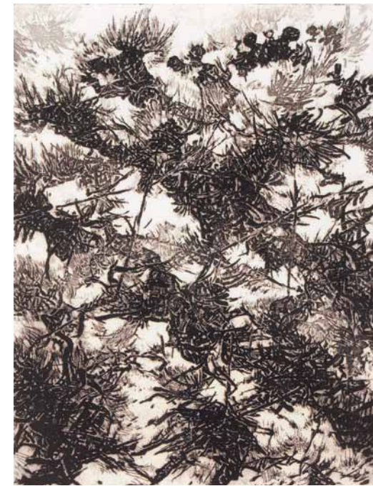
Cesco Magnolato, Gelso e viti , 1960