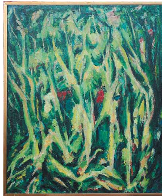
Gina Roma, Le betulle , 1962