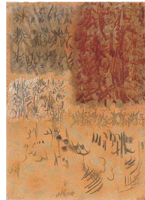
Riccardo Licata, Abstraction Musicale , 1955