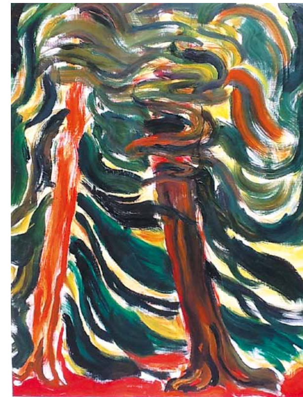
Virgilio Guidi, Grande Albero , 1972